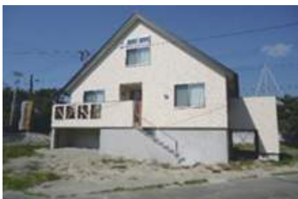
七ヶ浜復興住宅モデル展示場相談会会場

仙台東支部の今年度の活動ですが、5年前に建築した建物（林野庁補助による復興住宅モデル展示場）を支部活動の場として耐震診断等の勉強会（意見交換会）等にご利用しており、又モデル展示場として使用もしており、どなたでも使用する事が出来るので、会議などの場としても利用できるので使用したい方は事務所協会まで連絡頂ければ随時利用する事が出来ます。通常は七ヶ浜町の障害者の方々が訓練の場の一環として使用しております。又、平成33年には七ヶ浜町に無償譲渡する予定です。