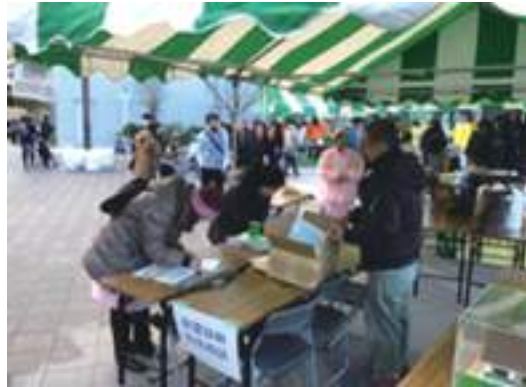
たがじょう市民市

多賀城市では、毎年行われる市民市が今年は今会場を駅前広場に移し、よりにぎわいのあるイベントとなりました。仙台東支部からもこちらのイベントに住宅相談や耐震診断等の啓蒙活動の場として参加致しました。