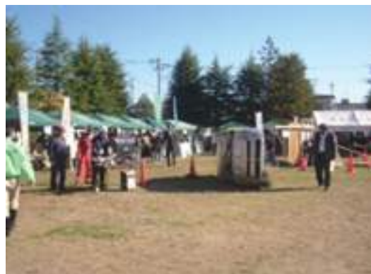
福住町防災訓練風景