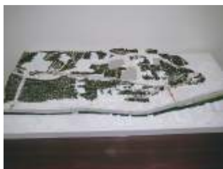
専門学校の部大賞