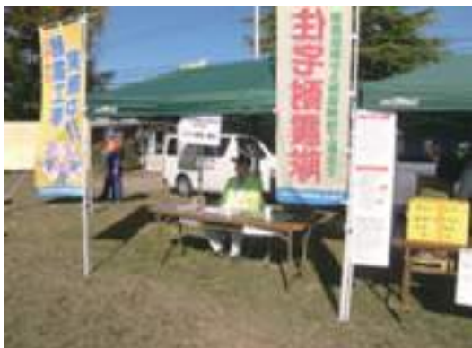
福住町住宅相談・耐震診断コーナー

仙台市宮城野区福住町にて毎年行われている地域住民参加による防災訓練が本年度も行われました。防災に関連するグループが多数参加され、仙台東支部からも住宅相談や耐震診断等の啓蒙活動の場として参加致しました。