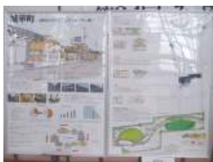
高等学校の部大賞

●次回(来年)は第25回ということまでこれまで以上に力を入れて取り組んで、皆さんに参加をしていただけるような企画を考えておりますので、どうぞ宜しくお願いを申し上げます。